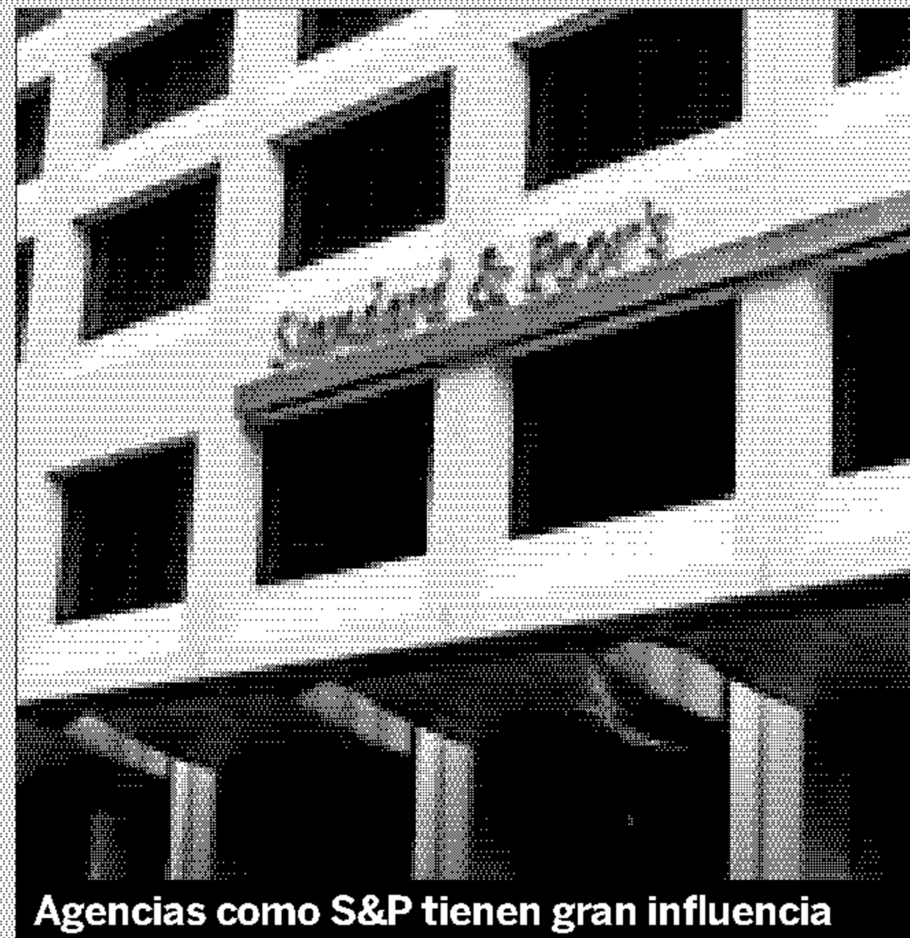
Agencias como S&P tienen gran influencia