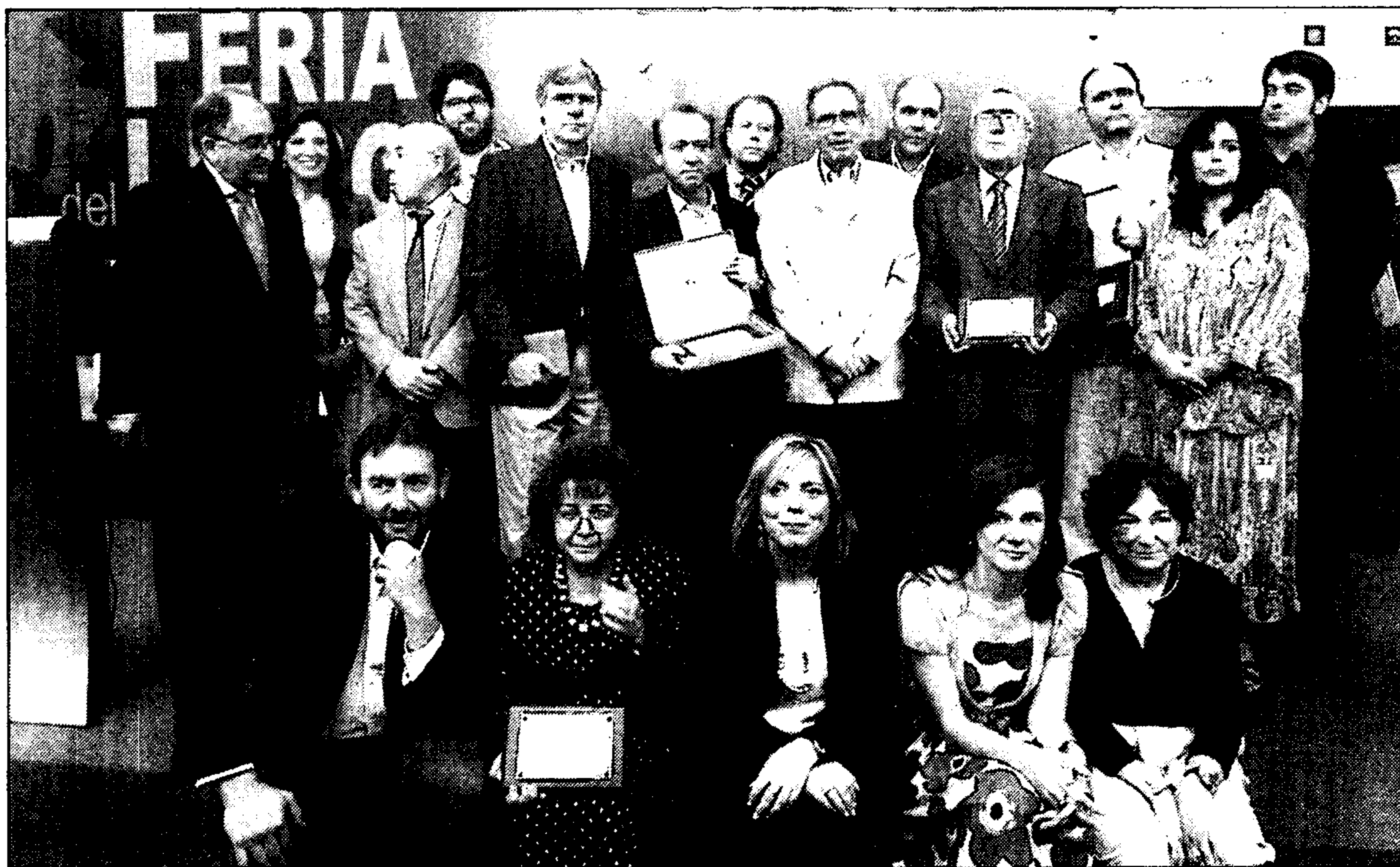
GALARDONADOS. Las premios de la Asociación Feria del Libro posan al término de la ceremonia.