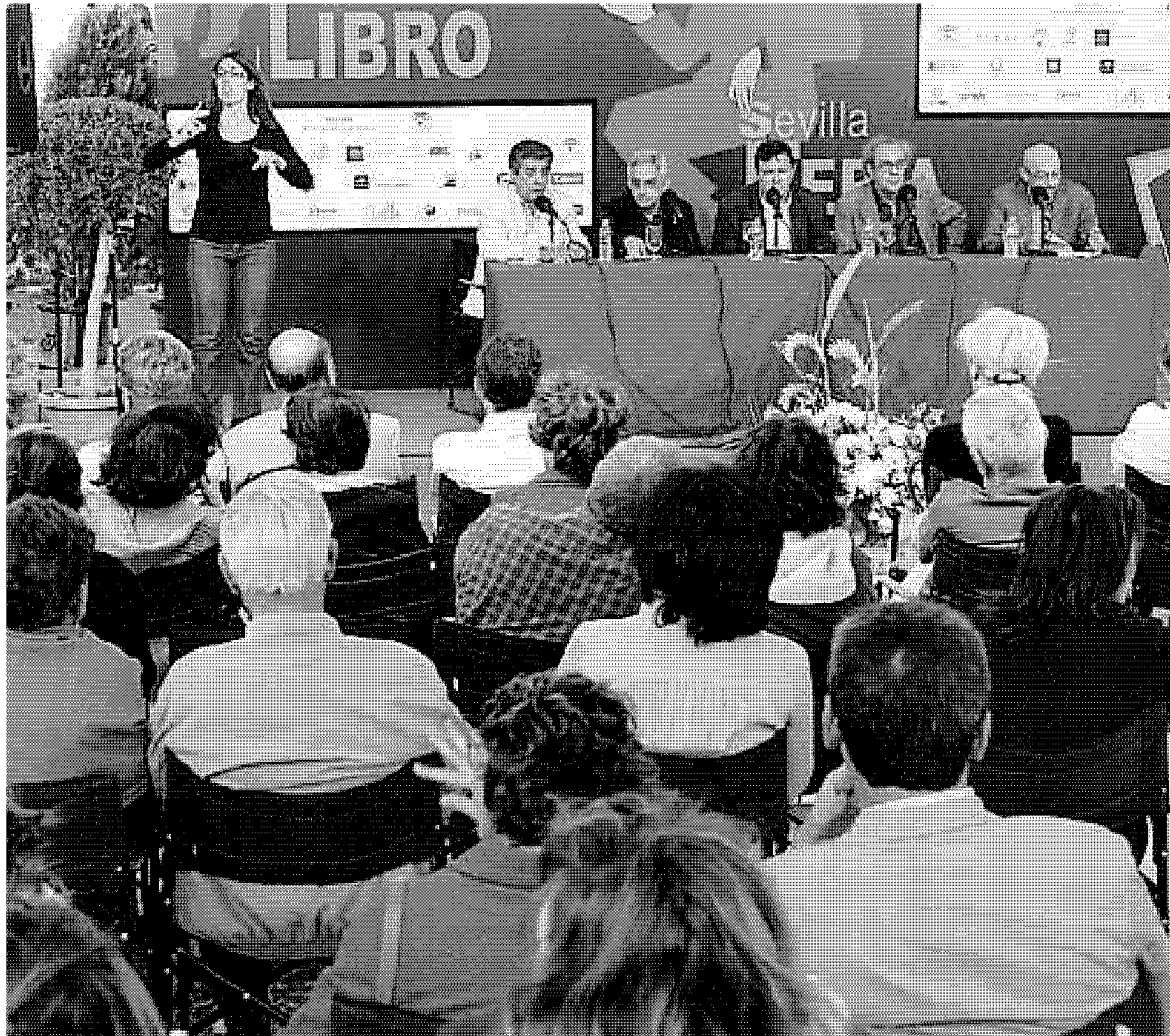
El homenaje a Machado ha sido uno de los últimos actos de esta Feria del Libro