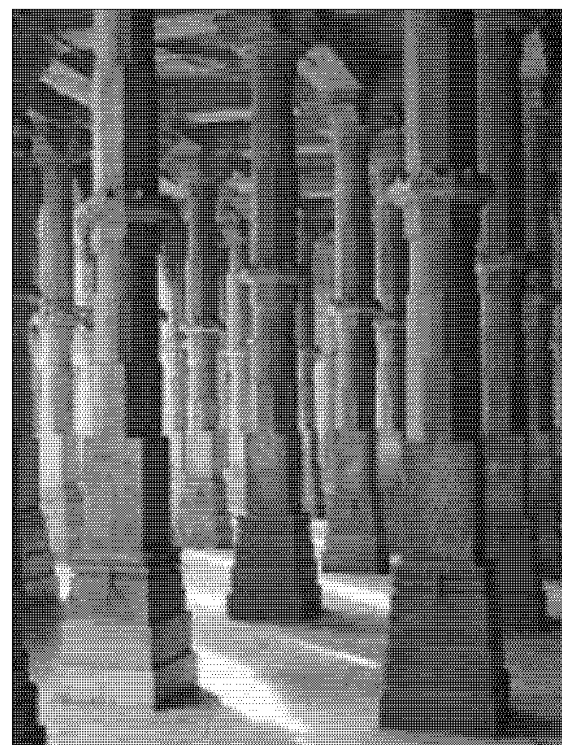
Mezquita Jumma Masjid.