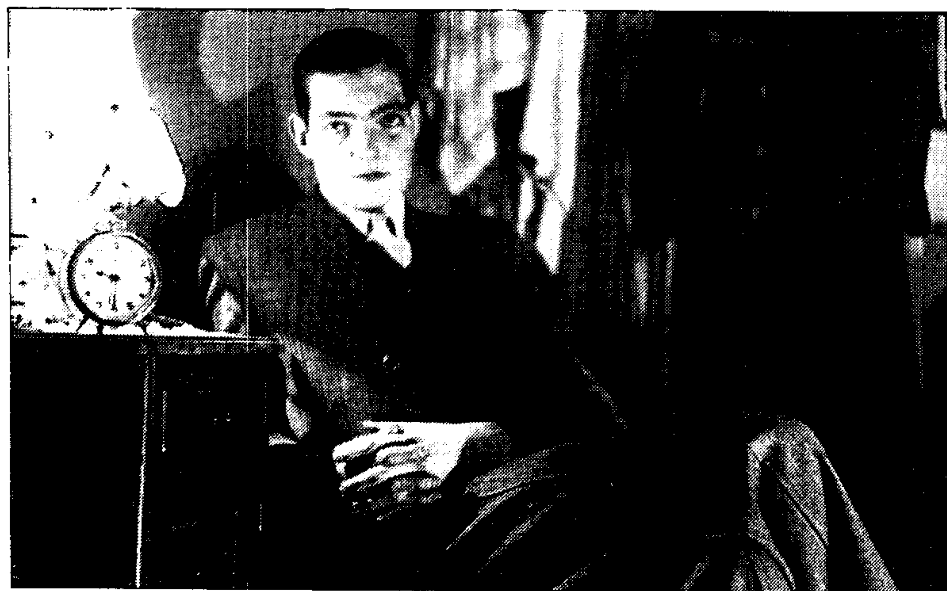
El joven Julio Cortázar, en Buenos Aires en 1938.