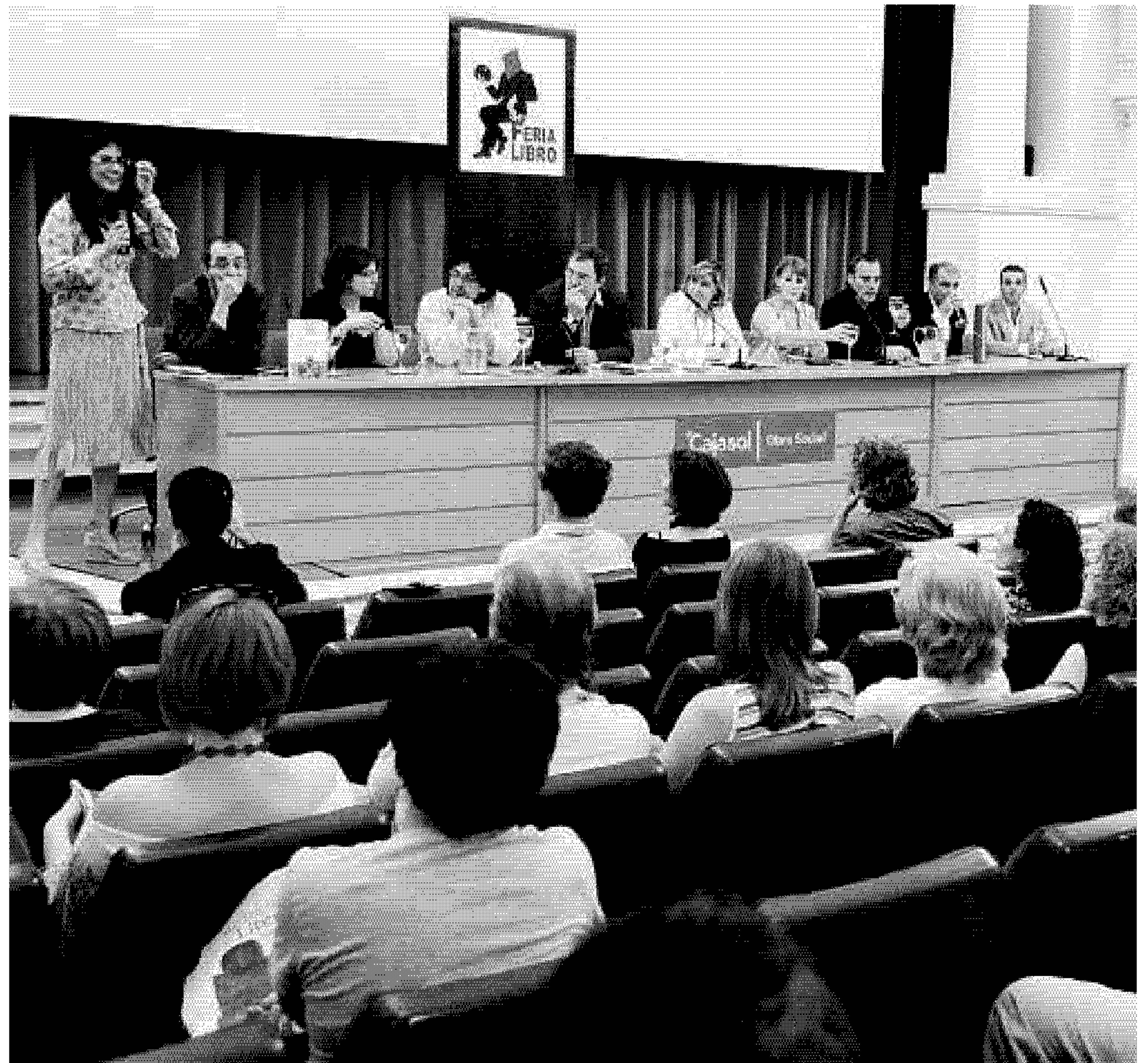
La figura de Julio Cortázar reunió a diversos especialistas y escritores

En un viejo almacén de un barrio popular de Santiago de Chile tres sexagenarios esperan impacientes la llegada de un hombre. Cacho Salinas, Lolo Garmendia y Lucho Arencibia, tres antiguos militantes de izquierda, derrotados por el golpe de estado de Pinochet, condenados al exilio y al desarraigo, vuelven a reunirse treinta y cinco años después, convocados por Pedro Nolasco, para dar el último golpe.